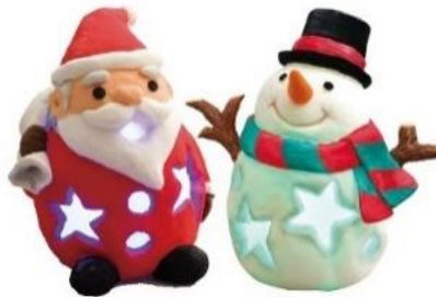
ねんどでランタン作り