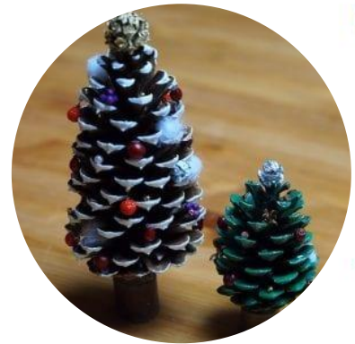
松ぼっくりツリー作り